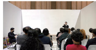
2022 아트페어 울산 아트경매