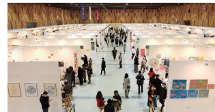
2022 아트페어 울산 전시전경