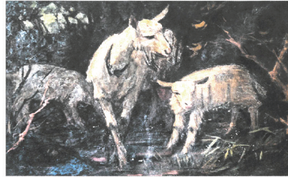
김남배 작 '호수'

9일 강연에는 박연희 아주대학교 문화콘텐츠학 과 교수가 "250과 전시의 지속 가능성"을, 서진