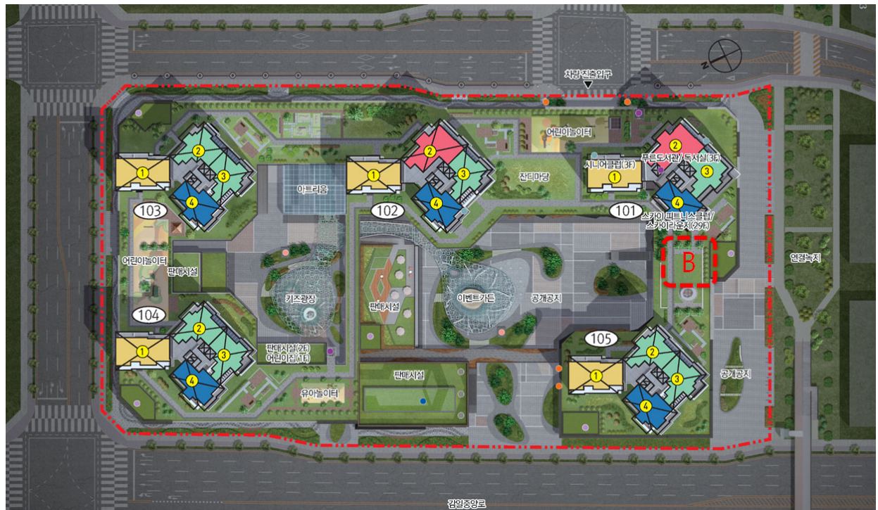
-작품B 설치 위치 투시도