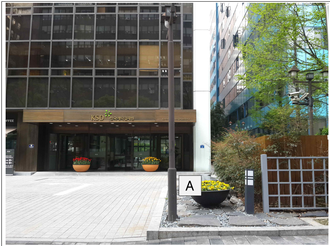
<설치위치 사진(서울사옥 정면)>