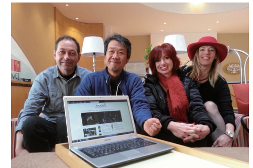
Meeting with the Committee Members of Site Specific in South Africa in 2013